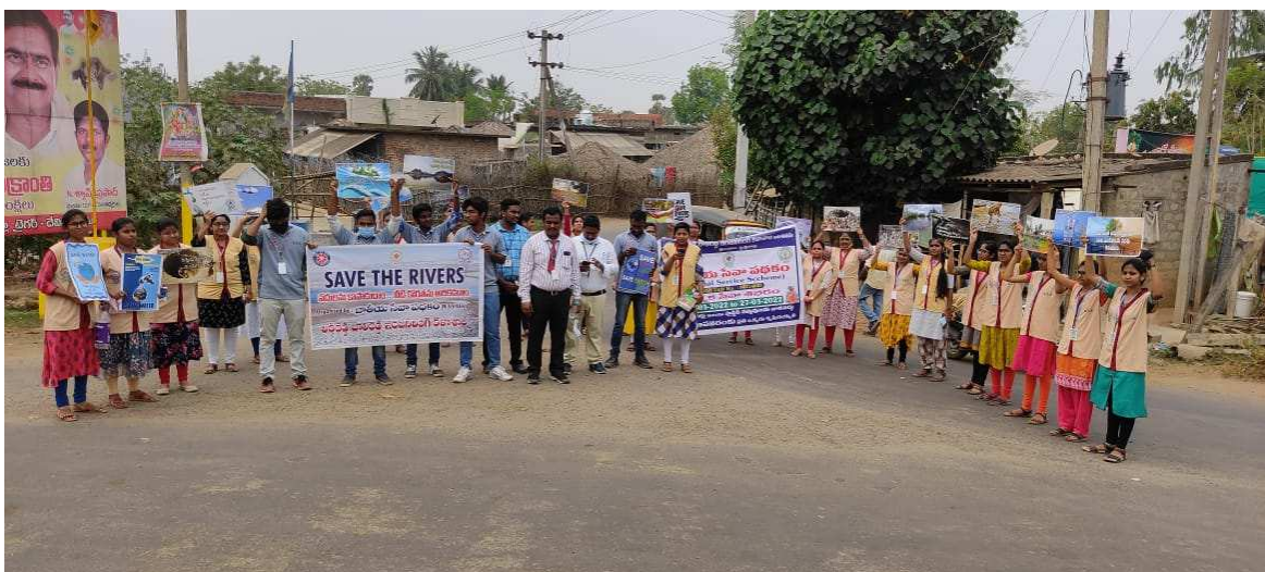
Slogans to public to save water