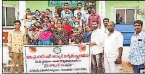
తుక్కులూరు ఆర్బీకే వద్ద శాస్త్రవేత్తలతో విద్యార్థులు