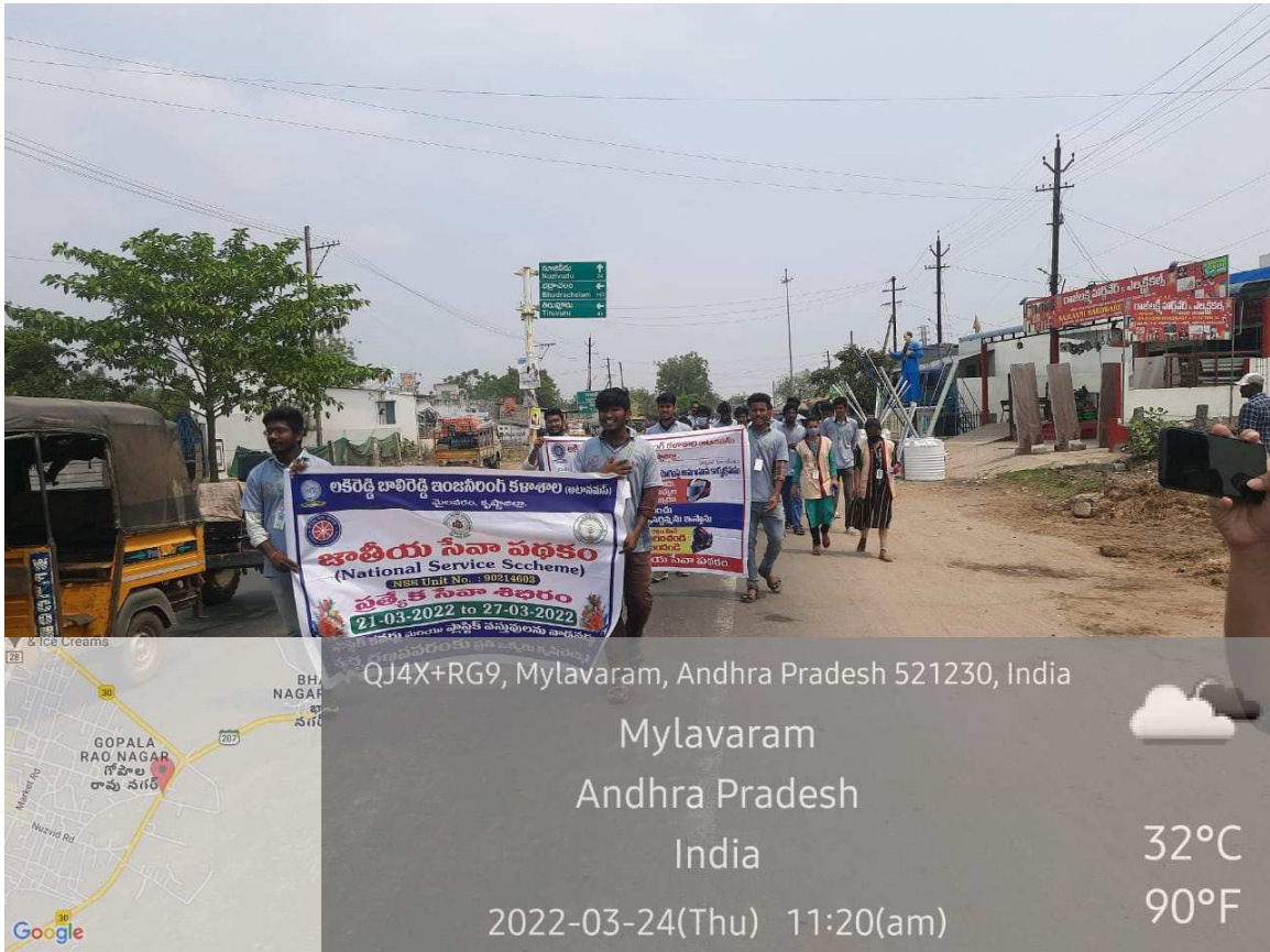
Rally on Traffic rules and guidelines to be followed during special camp