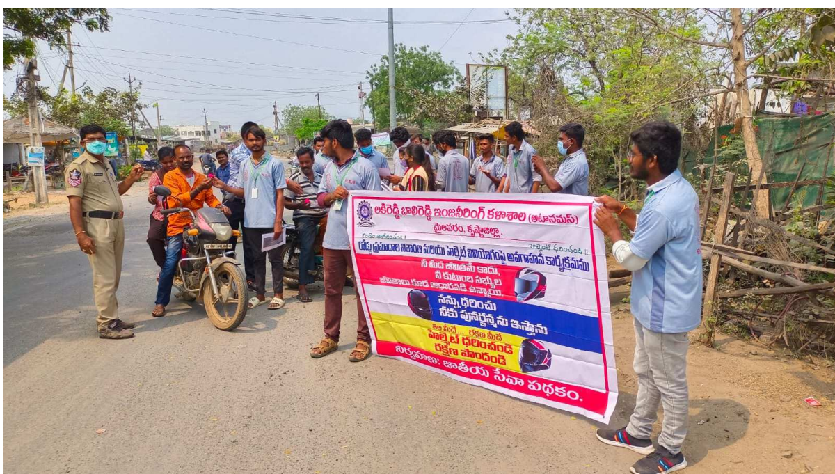
Police constable and NSS Volunteers creating awareness among usage of Helmet