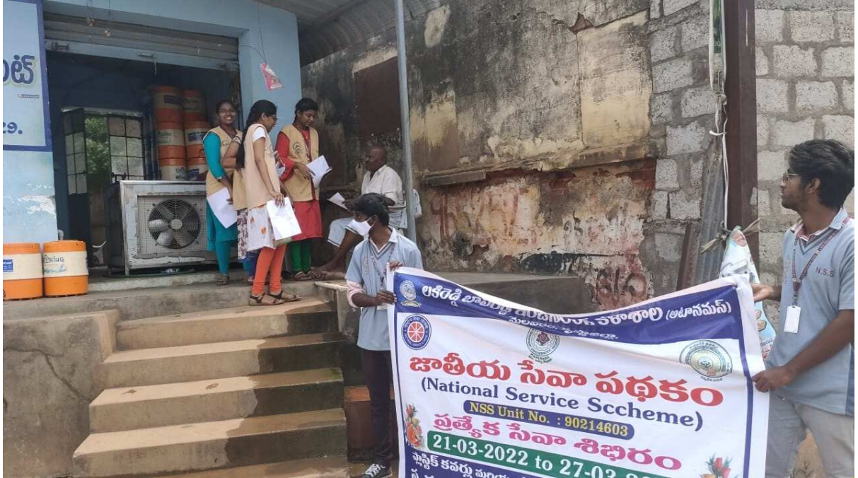
Rally on creating awareness among Ganapavaram Public regarding Hyperthermia Press Clippings (Day-5)