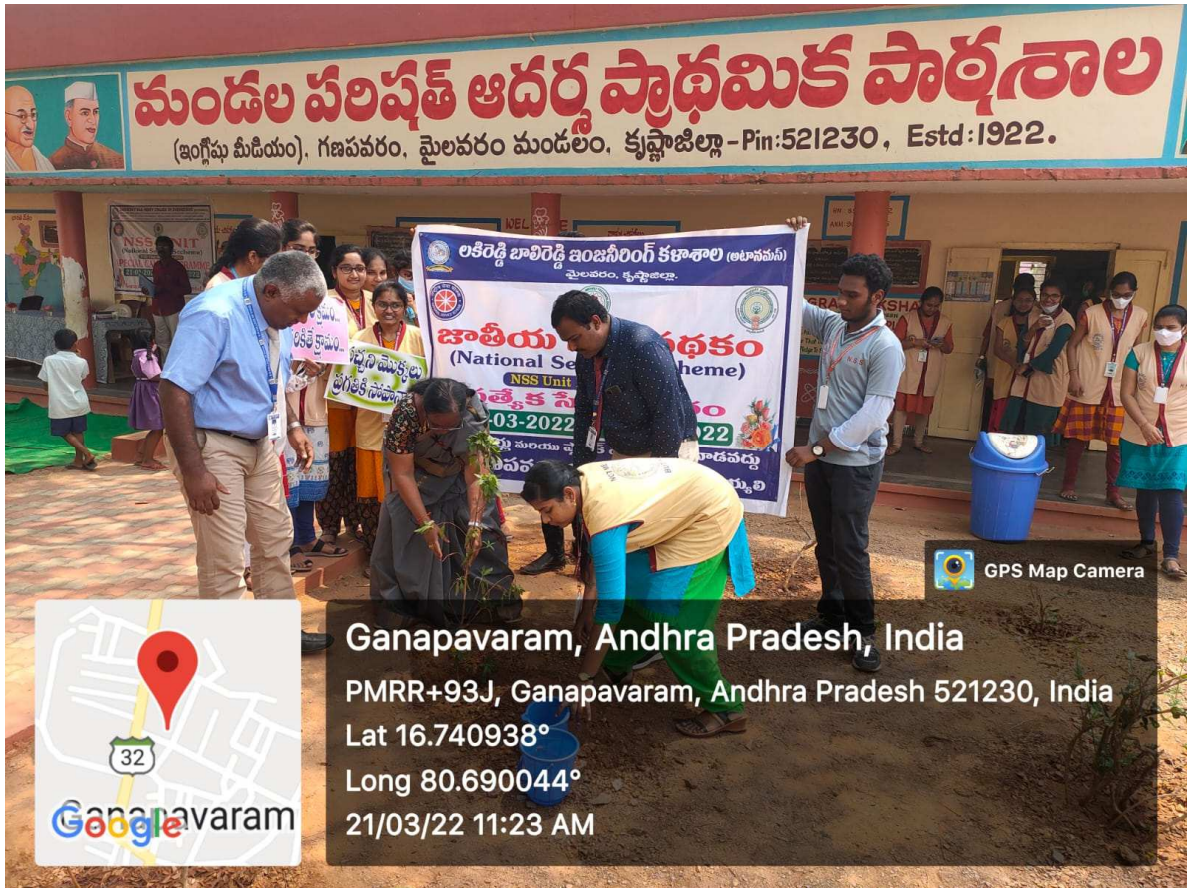
Tree plantation at Ganapavaram MPUP school