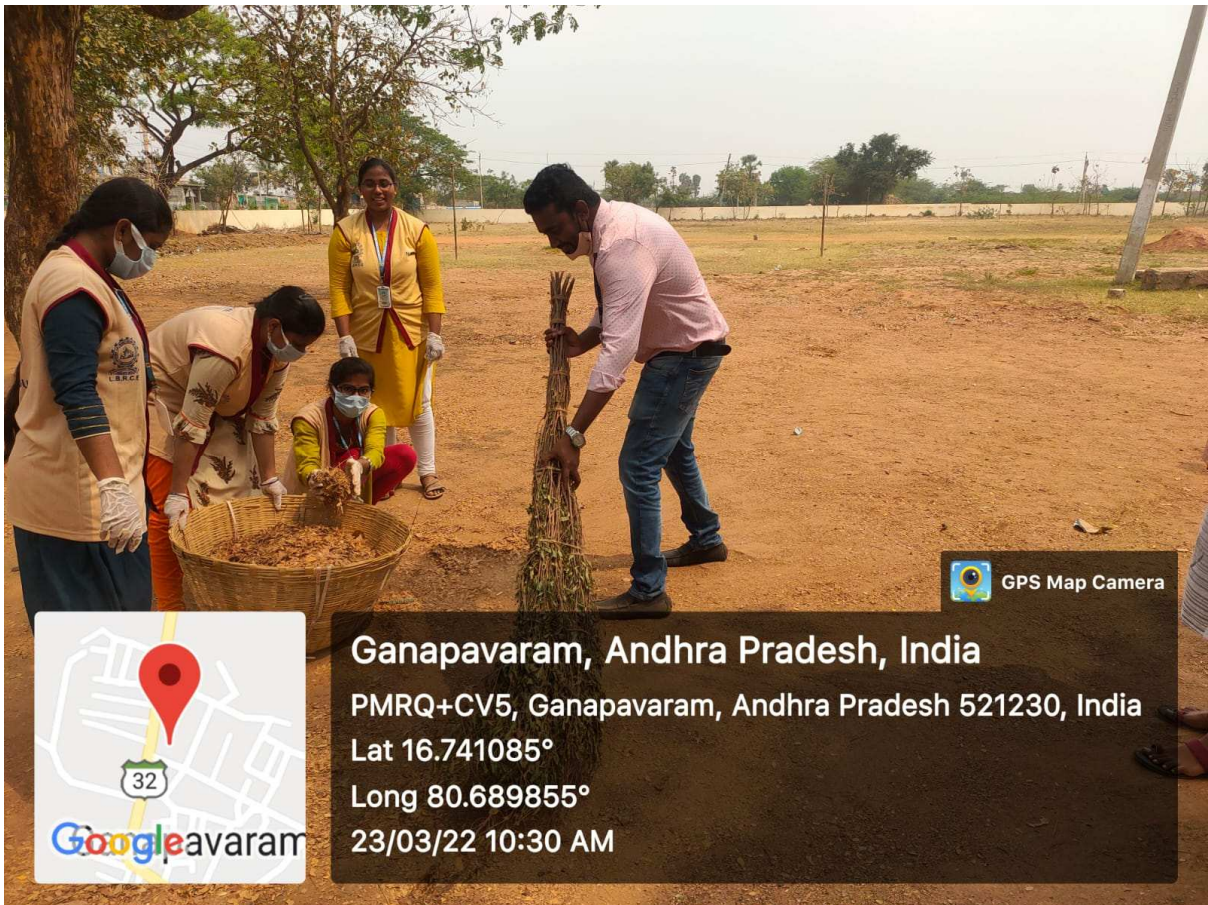
Swachh Barath at MPUP School by NSS Volunteers LBRCE