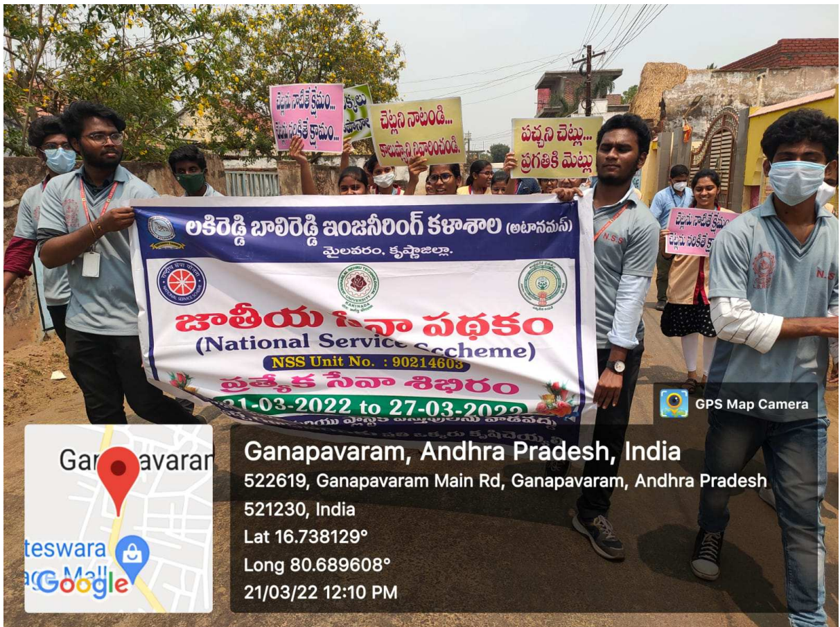
Rally on World Forest Day along with NSS Volunteers at Ganapavaram Village