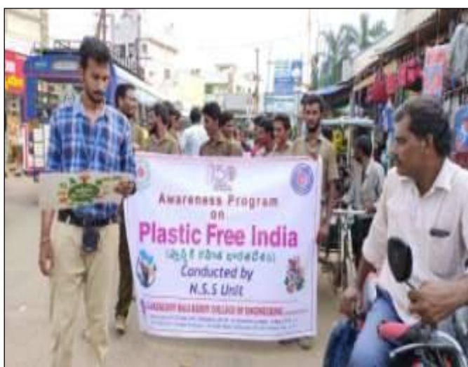
Students participation in the Rally