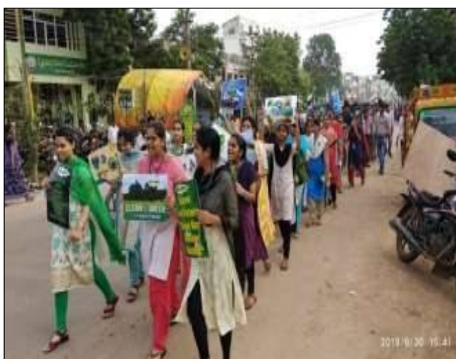
Students participation in the Rally