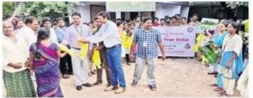
ప్రజలకు బ్యాట్ బ్యాగ్లు పంపిణీ చేస్తున్న కళాశాల సిబ్బంది, విద్యార్థులు