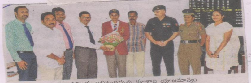
విద్యార్థులను అభినందిస్తున్న కళాశాల యాజమాన్యం