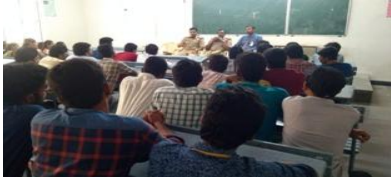
Volunteers briefed by the Police authorities on the eve of festival at Velvedam