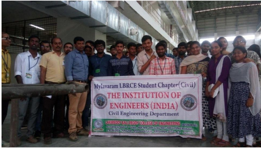
Civil Engg. students on an industrial visit