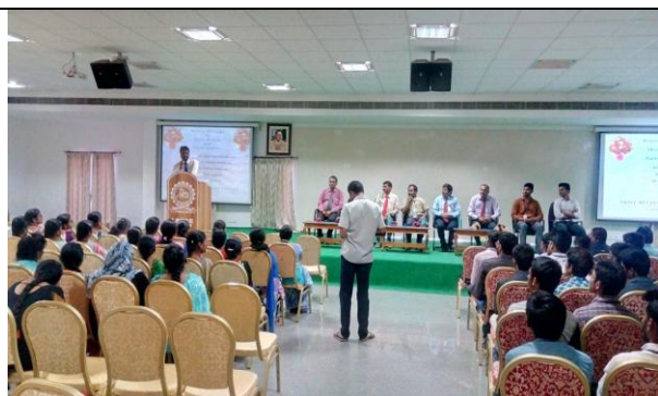
A view of the inaugural @ workshop on AutoCAD