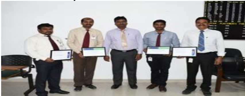
Jubilant Faculty sharing moments of glory with Principal and HoDs