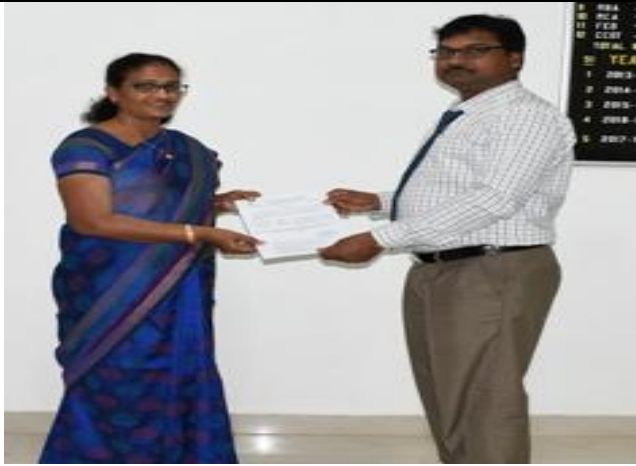
The Doctorate awardee felicitated by the Principal