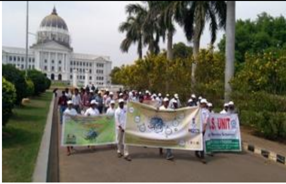
Students @ rally for “Preservation of Natural resources”