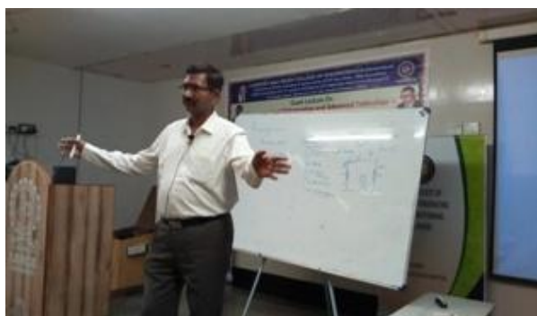
The resource person in action @ ISHRAE Guest Lecture