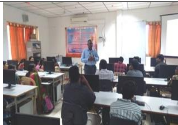
A view of the GL on Data Science in MCA