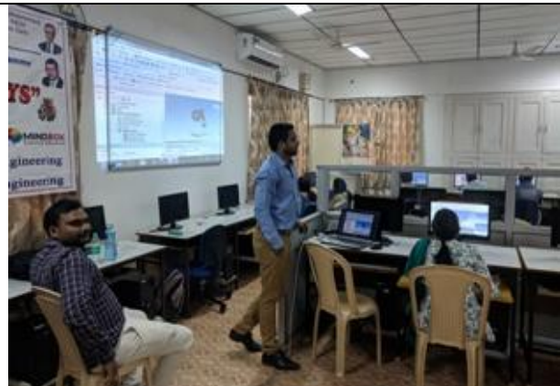
The Ansys program in progress...