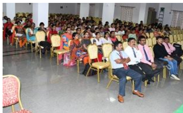
Participants snapped during the Salesforce program

The T&P cell organized a Training program on “Developing and deploying applications on Cloud” in association with Sales force developer team during the period i.e. 20 th -23 rd Feb’18. Students of CSE, IT and ECE participated in the program.