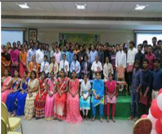
A grand reunion worth cherishing! Alumni posing for posterity @ Annual Meet