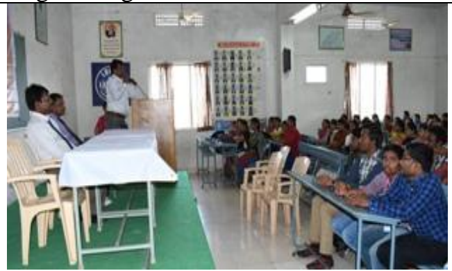
The expert addressing students @ seminar in MBA