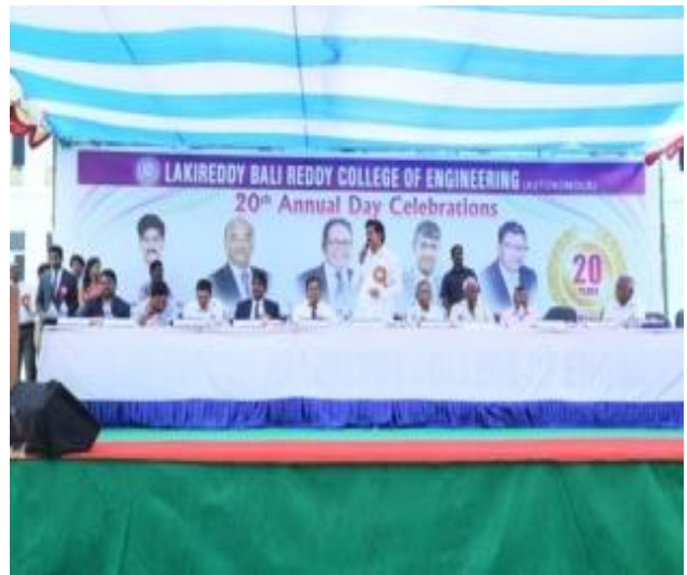
The chief guest addressing the audience @ 20 th College Day.