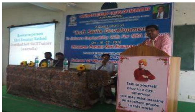
A view of the inaugural of the seminar in MBA