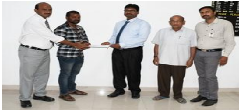
For a good cause ! Kin of the beneficiary receiving cheque