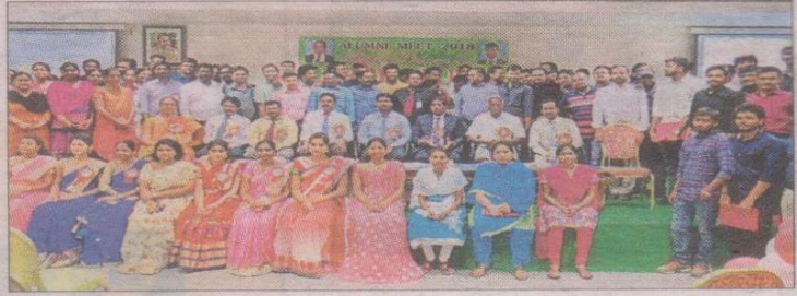
హాజరైన పూర్వ విద్యార్థులు