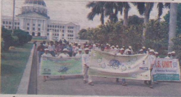
ర్యాలీ నిర్వహిస్తున్న విద్యార్థులు

మండించినప్పుడు వాయు కాలుష్యం ఏర్పడుతోందన్నారు. పర్యావరణ హిత మైన పెట్రోలియం ఉత్పత్తుల తయారీకి ప్రాముఖ్యమిస్తూ అందుకు అనుగుణంగా పరిశోధనలు నిరంతరాయంగా చేస్తున్నదని ఆయన తెలిపారు. పెట్రోల్, డీజిల్ వాడకం తగ్గించే అవకాశాలను, సహజ వనరుల సంరక్షణ, నిర్వహణ రాబోయే రోజులలో కీలకమైన అంశంగా మారనుందని తెలిపారు.