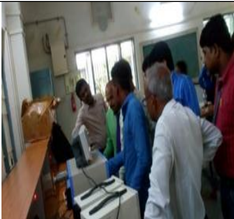
Faculty interacting with the resource person