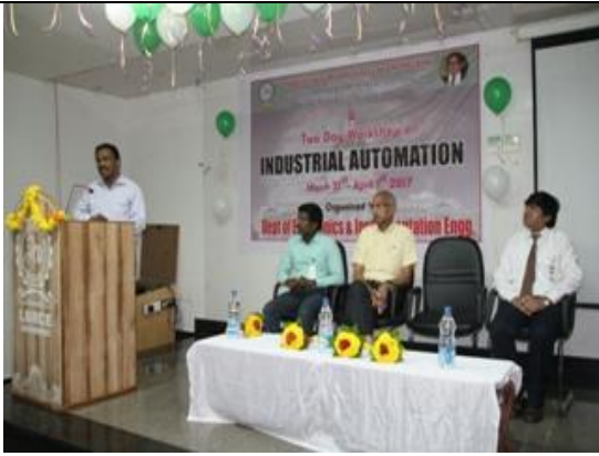
A view of the inaugural function