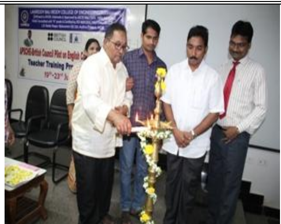
Chairman inaugurating the Teacher training Program