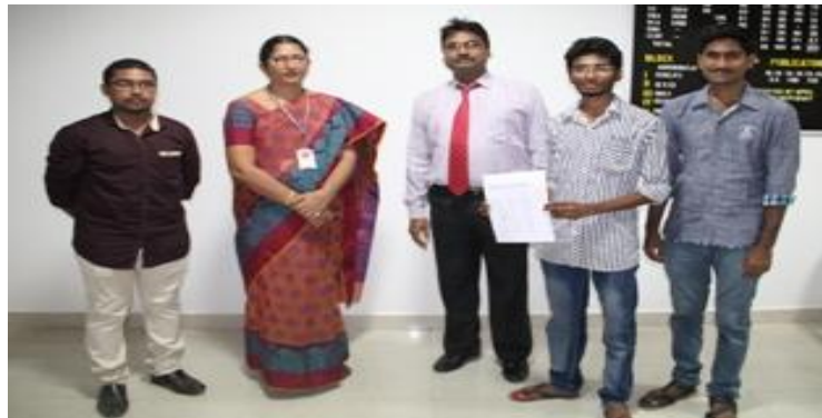
Selected students with the Principal & HoD