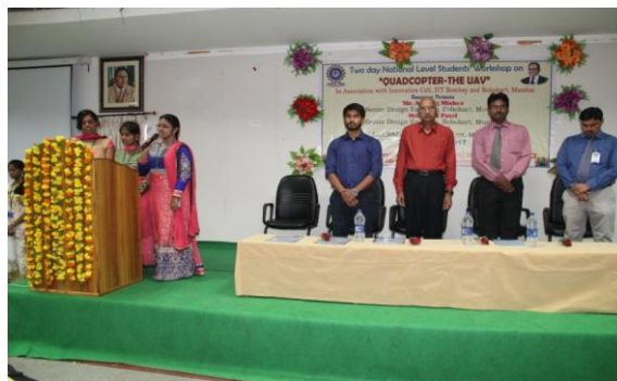
A still from the inaugural of the workshop