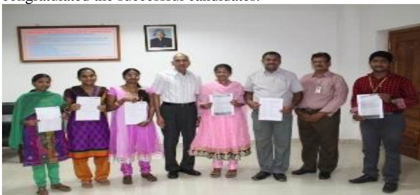
Successful students posing with Director, HoD & others