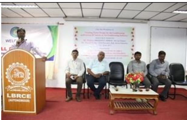
The Head of the department delivering inaugural address @ workshop