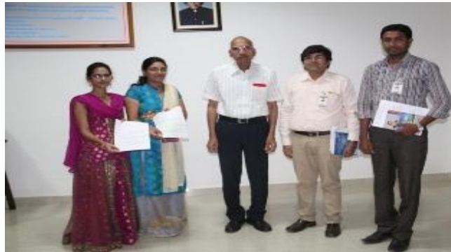
Students with Director, HOD &amp; Mentor