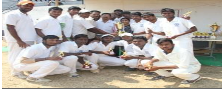
College Cricket team with the Runner up Trophy