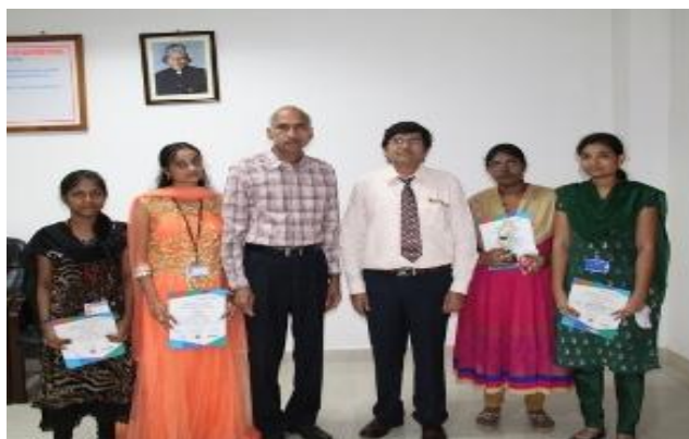
Prize winners posing with Director & HoD