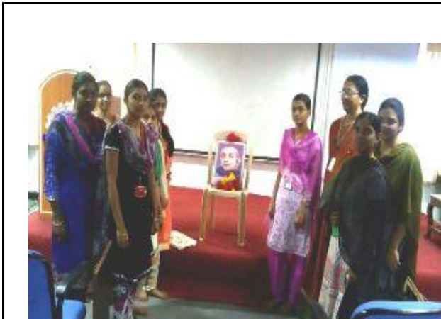
A snap from the National Women's Day function @ LBRCE