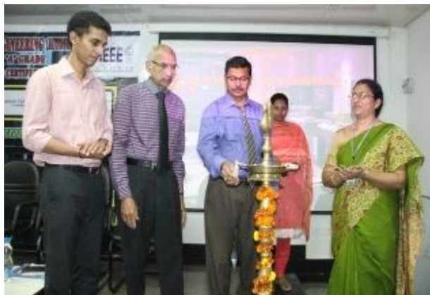
Hon'ble Vice chairman inaugurating workshop @EEE