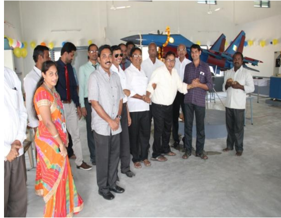
The Mig 21 Prototype is seen in the background