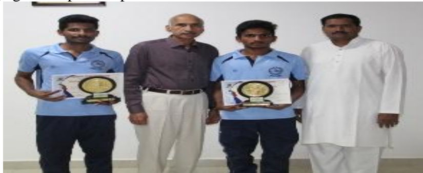
Yoga winners posing with Director & Yoga instructor