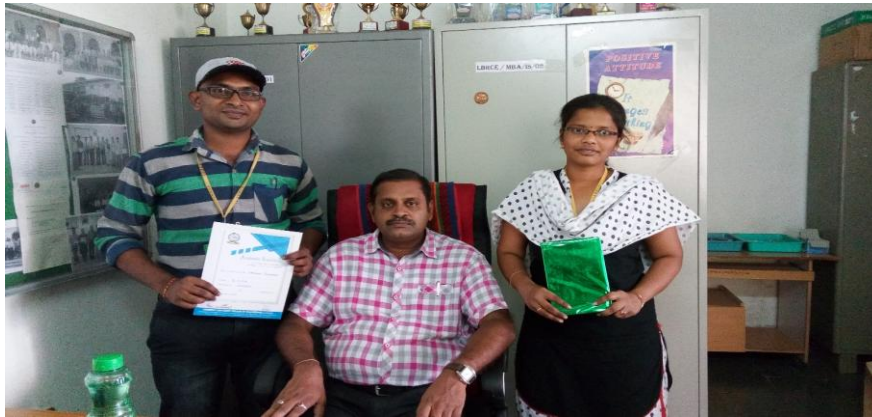
MBA Academic toppers posing with the HoD