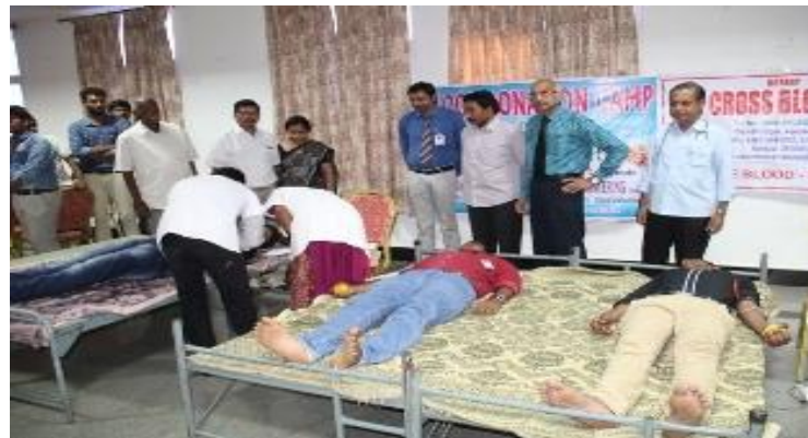
Blood Donation camp is in progress...