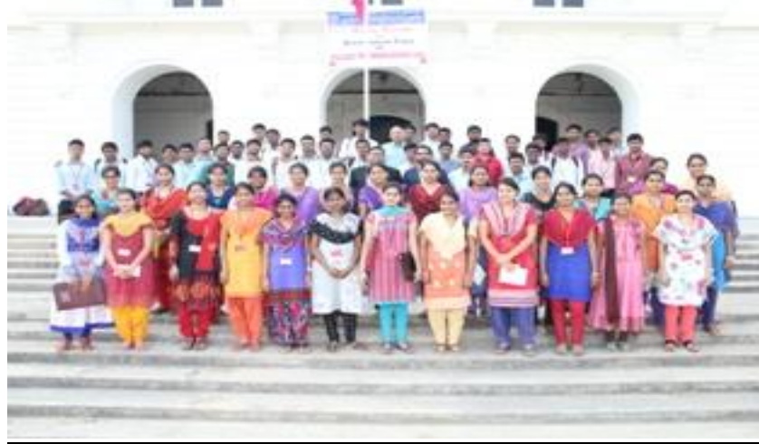
Jubilant students sharing their moment of glory with Director & Placement Team