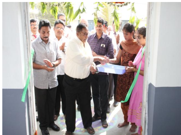
Chairman at the inauguration of facility in ME