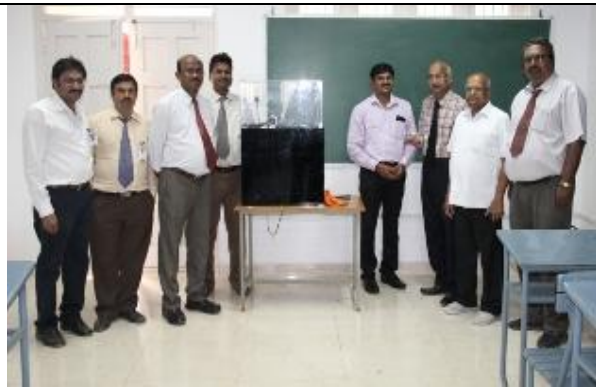
Director posing with senior professors @ workshop in Civil