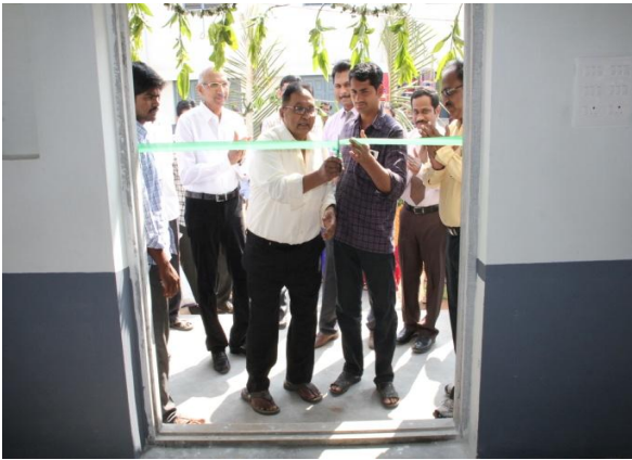
Chairman inaugurating the facility