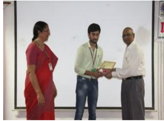
A still from the National Science Day @LBRCE