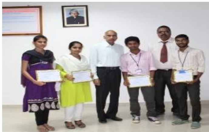
Prize winners posing with Director & HOD