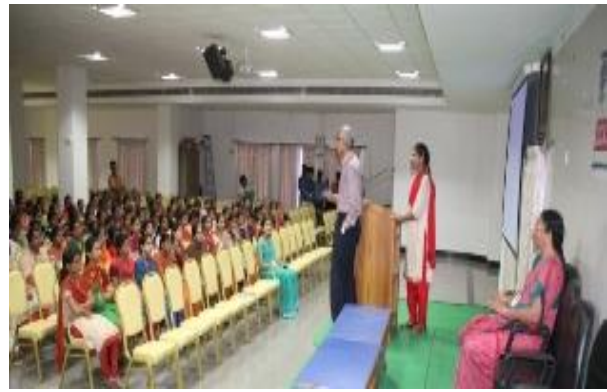
Director addressing students @ IEEE event