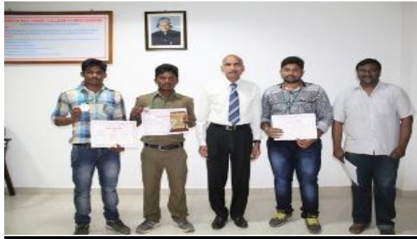
Power Lifting winners posing with Director & Coach