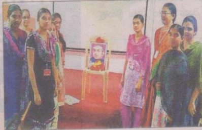
సరోజినీనాయుడు చిత్రపటానికి పూల మాలలు వేసి నివాళులర్పిస్తున్న విద్యార్థినులు

మైలవరం: మైలవరం లకిరెడ్డి బాలిరెడ్డి ఇంజనీరింగ్ కళాశాలలో జాతీయ మహిళా దినోత్సవాన్ని సహేల-ద గరల్స్ క్లబ్ అధ్యక్షులలో మంగళవారం ఘనంగా నిర్వహించారు. సరోజినీనాయుడు చిత్రపటానికి పూలమాలలు వేసి నివాళులర్పించారు. వక్రలు మాట్లాడుతూ భారతదేశ తొలి మహిళా గవర్నర్గా పనిచేసిన సరోజినీనాయుడు పుట్టిన రోజున జాతీయ మహిళా దినోత్సవంగా పాటిస్తున్నామన్నారు. మహిళల అభ్యున్నతికి సరోజినీనాయుడు చేసిన సేవలు గుర్తింపుగా దేశ వ్యాప్తంగా ప్రతి సంవత్సరం మహిళా దినోత్సవం జరుపుకోవడం అభినందనీయమన్నారు. సరోజినీనాయుడు బాల్యం, విద్యాభ్యాసం, మహిళా సంక్షేమానికి ఆమె చేసిన వివిధ కార్యక్రమాలు,