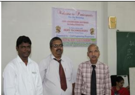
The resource person with the Director & HoD