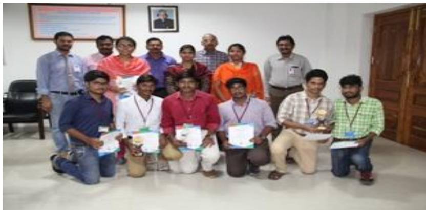
Prize winners sharing their glory with Vice chairman, Director, HoD & others